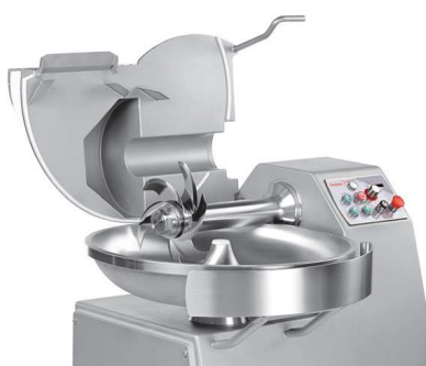
Perfecto acabado de los ángulos redondeados